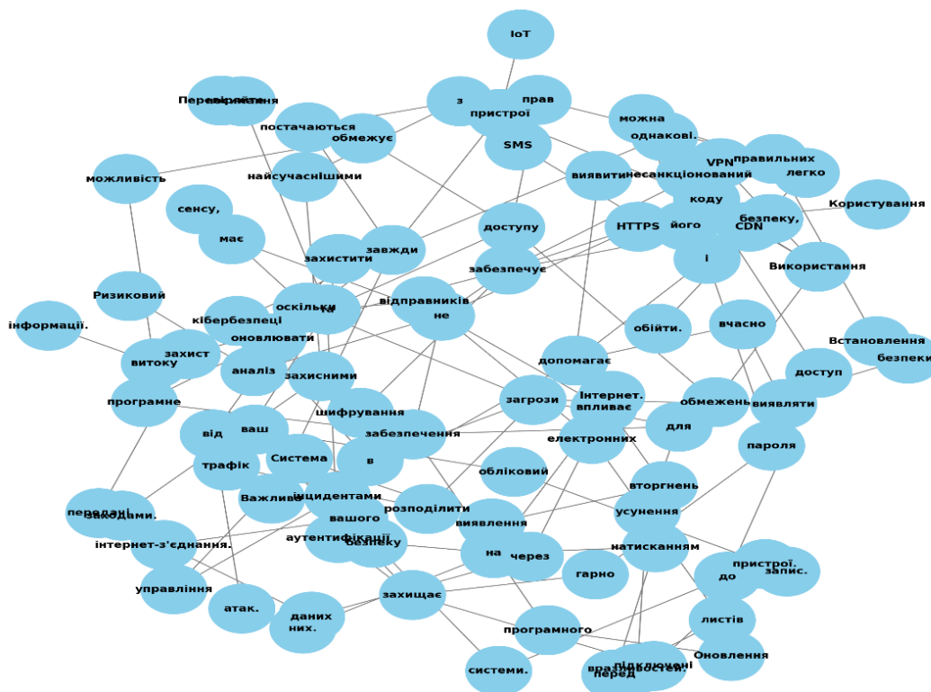
Рисунок 2 – Мережа слів згенерована із масиву повідомлень

Prompt 3 – згенеруй масив повідомлень фейкової та правдивої інформації за допомогою представленої вище мережі слів.